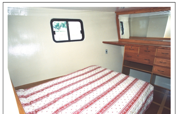
● Camarote Casal