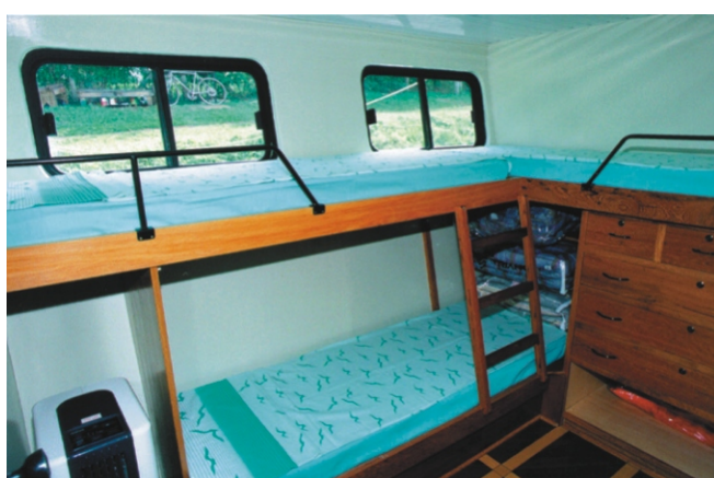
● Camarote Triplo